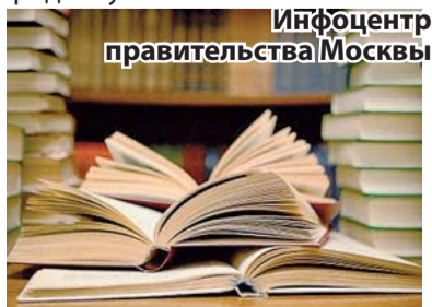
Инфоцентр правительства Москвы

ные руководители, прошедшие специальную подготовку по предмету.